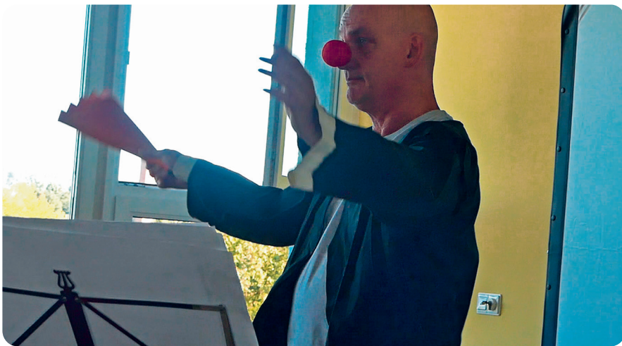
Abb. 2: Die symbolische Nase des Clowns

Ist diese Gruppe sicher, erhält die zweite Gruppe ihre Aufgabe. Sie müssen viermal im Takt hintereinander klatschen, erfahrungsgemäß geht das relativ schnell, weil die Gruppe aus den Fehlern der ersten Gruppe gelernt hat. Der dritte Block muss einen Rhythmus von eins – zwei, Pause, eins – zwei aufnehmen.