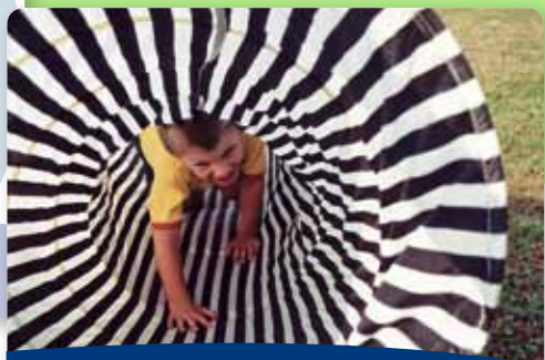
[74] Kreativität und Psychomotorik