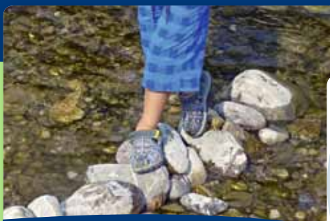
[56] Psychomotorik in der Natur