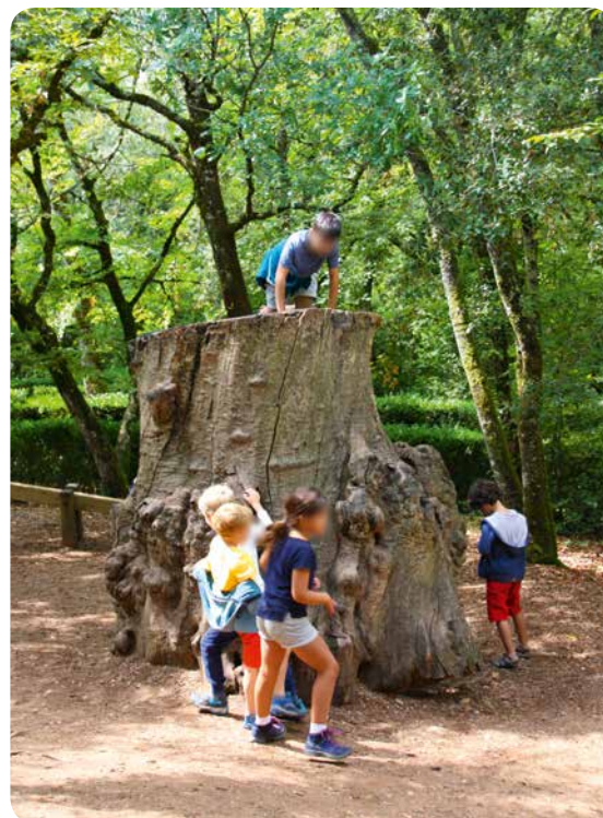
Abb. 1: Kinder in der freien Natureroberung

Die Verfügbarkeit und der selbständige Zugang zu diesen frei zu gestaltenden Spiel- und Bewegungsaktivitäten entscheiden über die Quantität an subjektiven Lernwelten. Neben den Spielaktivitäten selbst wirkt sich auch die selbständige Erschließung des Streif- und Spielraumes im Wohnumfeld des Kindes positiv auf die Entwicklung aus (Abb. 1).