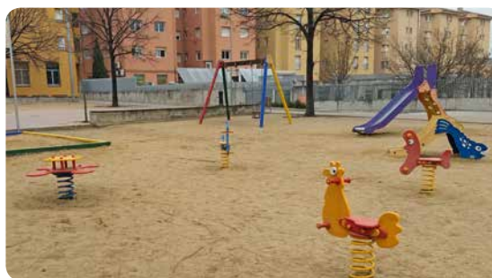
Abb. 2: Normierte Spielgeräte

Auf politischer Ebene ist die Einwirkung auf städtebauliche Maßnahmen ein erster Schritt, wieder Spielflächen zu schaffen, die Kinder gefahrlos erreichen können und ihnen Möglichkeiten der eigenen Gestaltung und Veränderung sowie Rückzug anbieten. Die Stiftung Naturschutz Berlin hat im Frühjahr 2018 eine Resolution für die Schaffung von Naturerfahrungsräumen in der Stadt (Stiftung Naturschutz Berlin 2018) verfasst, in der nicht nur die Bereitstellung solcher Räume in jeder Stadt angestrebt, sondern eine rechtlich verbindliche Verankerung im Baugesetzbuch gefordert wird. Bestehende Spielplätze bieten zwar ein Spektrum an Bewegungsaktivitäten, decken durch ihre normierten Geräte allerdings nur einen Teil der erforderlichen Spielraumqualität ab (Abb. 2).